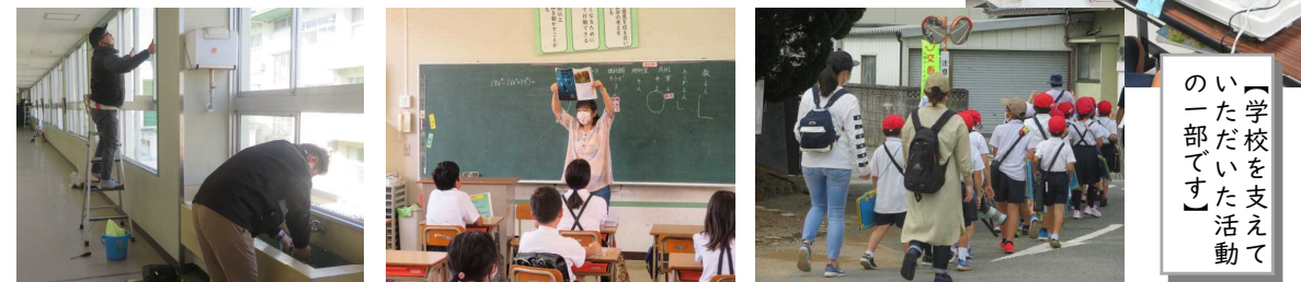
【学校を支えていた活動の一部です】

上記にありますように、福島小学校は「地域とのつながり」を大切にした教育活動を推進していきたいと考えています。子どもたちが、ふるさと「福島」に興味関心をもつことができる学習を行うこと地域の人と一緒に学ぶ機会を大切にしたいと思っています。写真は、本年度学校を支えていただいた一部の活動です。ご支援いただきました多くの皆様、ありがとうございました。