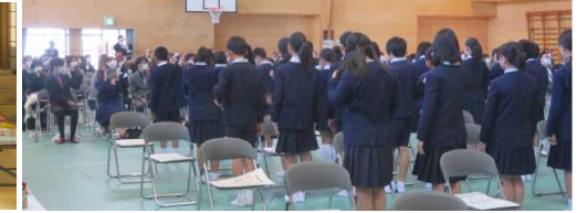
【卒業式：6年生の言葉】